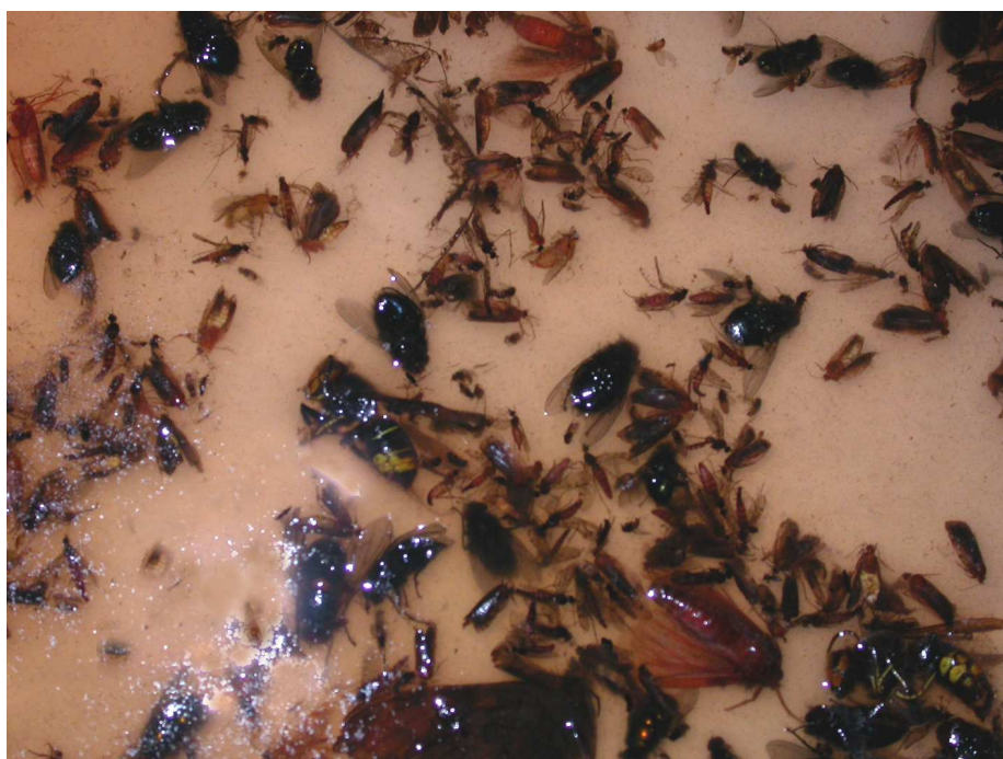
Fig. 2. Aspect du contenu du piège n°6 (17 VI 2009).