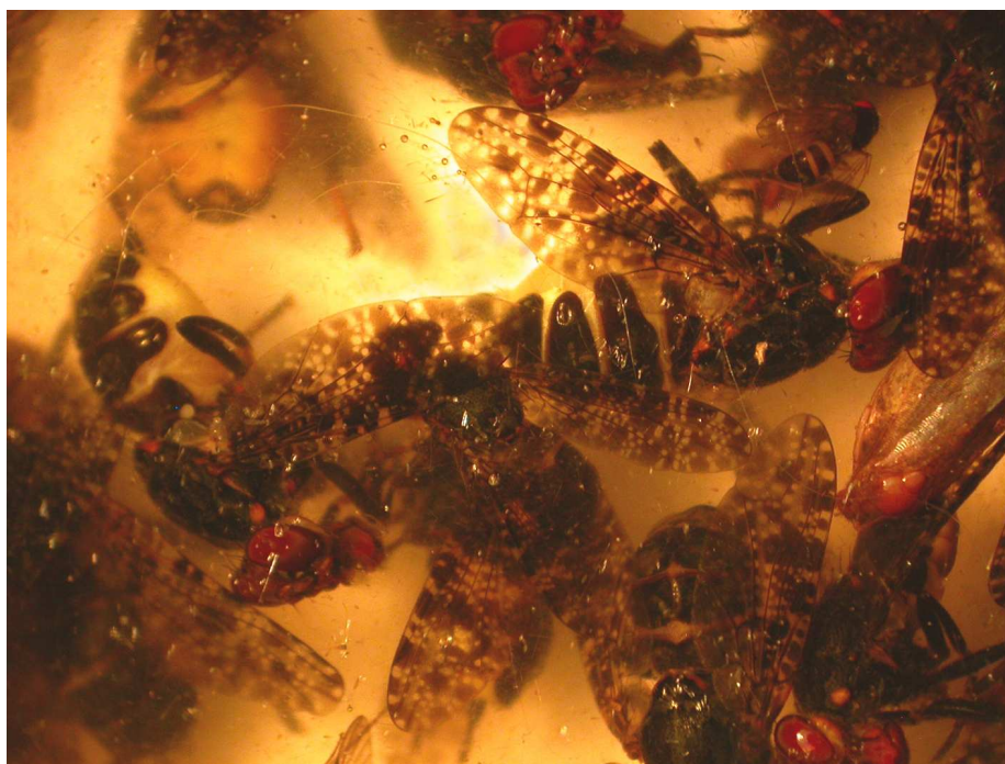
Fig. 1. Dans le piège n°1 (24 VI 2009), nombreux Diptères ( Platystoma ).