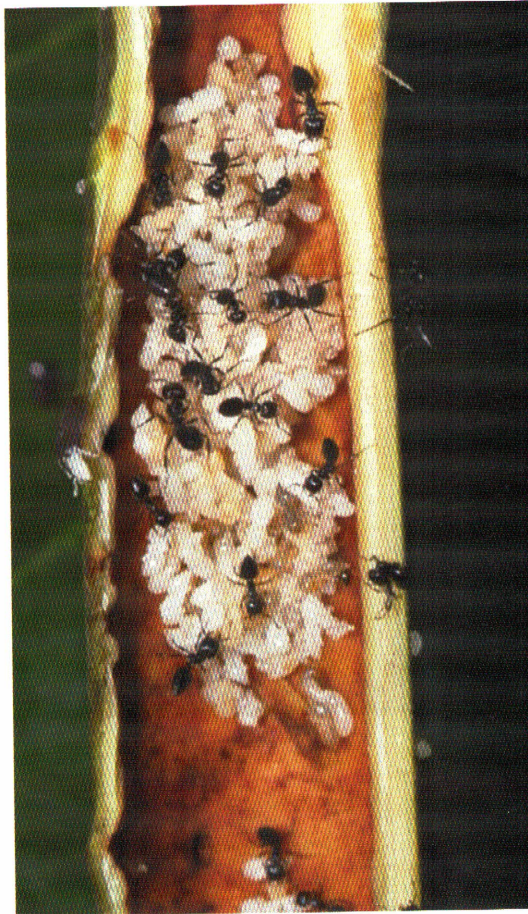
Fourmis Crematogaster vivant dans une tige creuse de Barteria fistulosa (Afrique).

Nous commençons tout juste à appréhender les capacités sensorielles des plantes, et chaque nouvelle découverte nous fait prendre conscience à quel point nous sommes ignorants à ce sujet. Les plantes sont capables d'émettre des signaux qui modifient le comportement des insectes auxquels ils sont destinés. C'est un fait avéré par de nombreuses études. Nous avons vu en effet que, dans le cas des symbioses entre myrmécophytes et fourmis, ces signaux sont mis en jeu dans différents types de situations à bénéfices réciproques, telles que la rencontre des partenaires symbiotiques ou la défense de la plante. En revanche, rien n'est connu sur les signaux émis par les insectes en direction des plantes. Le seul indice connu à ce jour chez les myrmécophytes est que les plantes du genre Piper ne produisent des corps nourriciers qu'en présence de leurs fourmis mutualistes. La plante perçoit donc la présence des fourmis, et évite ainsi de gaspiller des ressources quand les fourmis sont absentes. Les symbioses entre