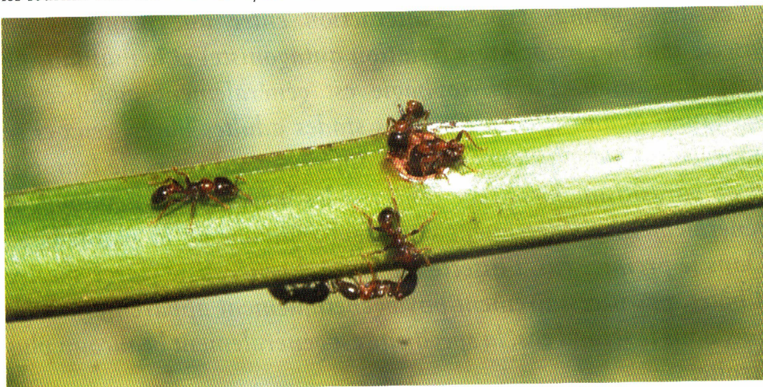
Domatie de Tachigali sp. formée par le pétiole creux, occupée par Pseudomyrmex malignus (Amérique du Sud).