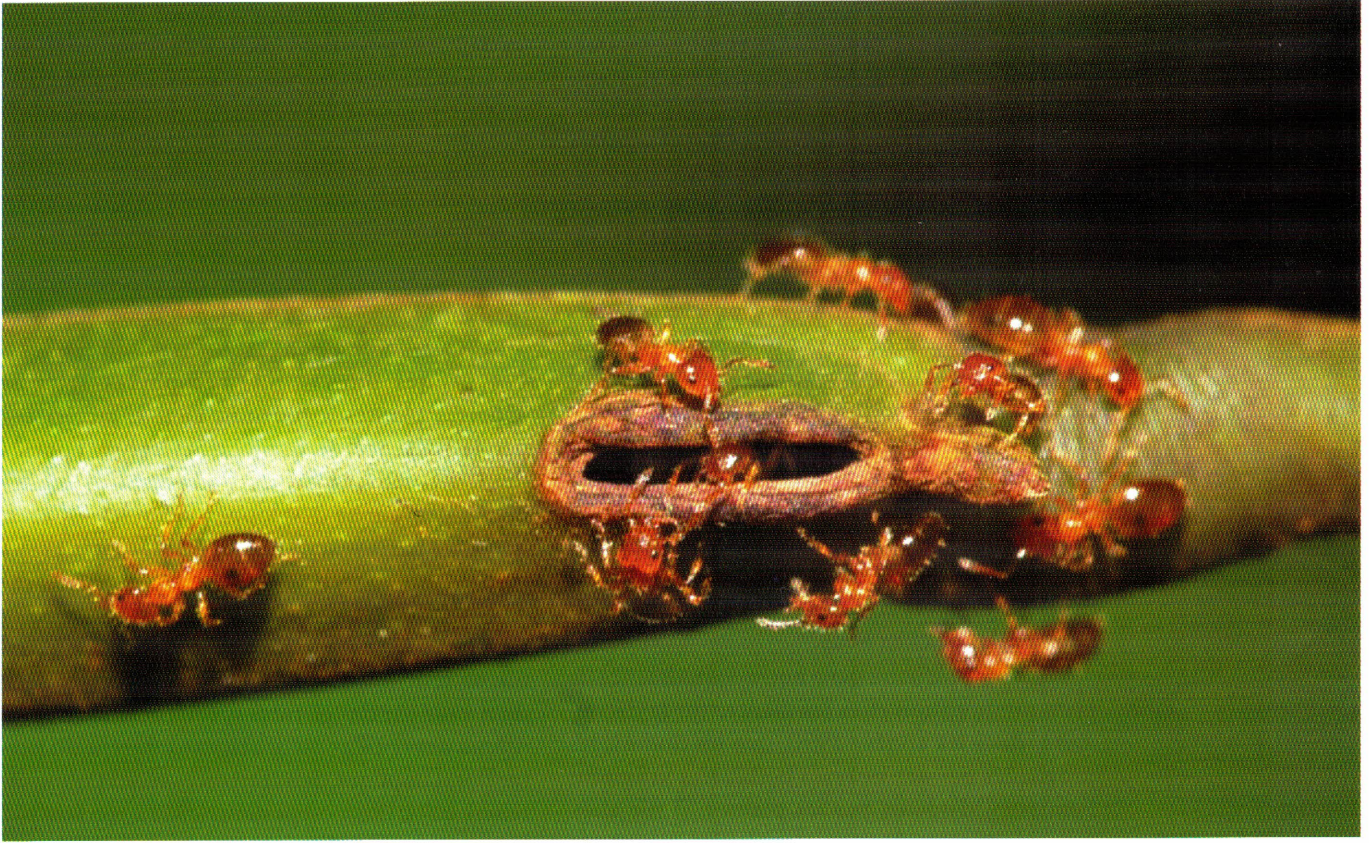
La plante Leonardoza africana et sa fourmi associée Petalomyrmex phylax : une relation très intime.