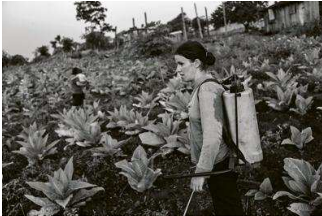
En Argentine, troisième producteur mondial de soja, l'usage des pesticides est très répandu, comme ici dans les champs de la province de Santiago del Estero (à gauche). Le Roundup, le désherbant star de Monsanto, est utilisé en pulvérisation sur des plants de tabac dans la province de Misiones (ci-contre, en haut). En bas : l'un des entrepôts de la firme américaine dans la province du Chaco.